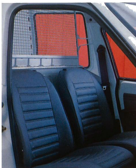
Scheidingsrooster in accessoire